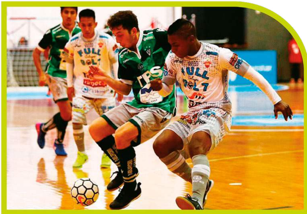
Santiago Wanderers Futsal disputando la Copa Libertadores 2017.

Nuestro equipo de Futsal, trabaja dos veces por semana, en la mejor cancha de Futsal de nuestra región, ya que tiene las medidas reglamentarias y una superficie ideal para el buen desarrollo de nuestros jugadores. Centro que fue facilitado por 2 años, debido a inversiones realizadas por nuestra Institución en dicho centro deportivo, con el fin de optimizar el trabajo de los ocupantes del recinto.