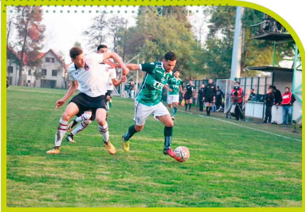
Sub 19 subcampeona del campeonato nacional de Fútbol Joven 2017.