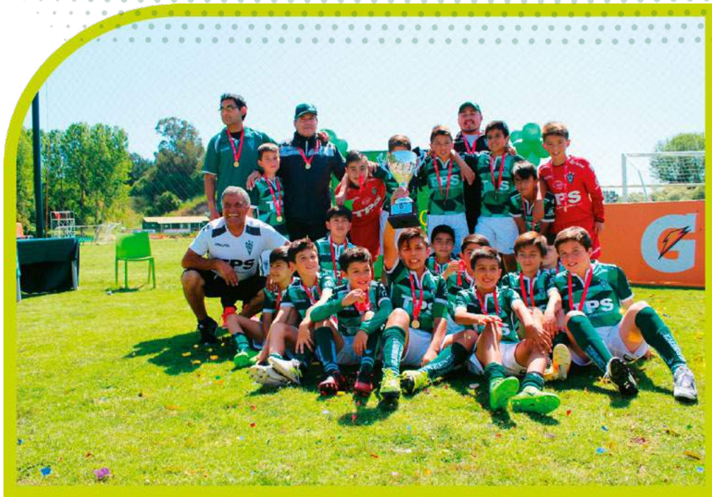
Celebración Santiago Wanderers Campeón Sub 11, 2017.